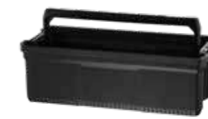
Bandeja profunda com pega Os fechos laterais seguram a caixa acima do elevador