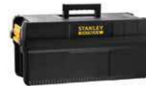
Caixa 25" IP54 e pega ergonómica