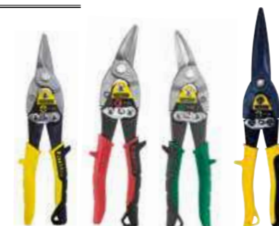
Corte reto Corte esquerda Corte direito Corte longo