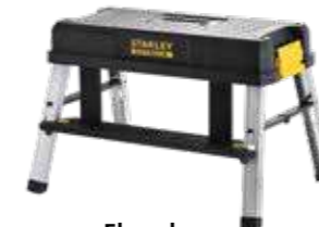
Elevador 150kg de capacidade máxima